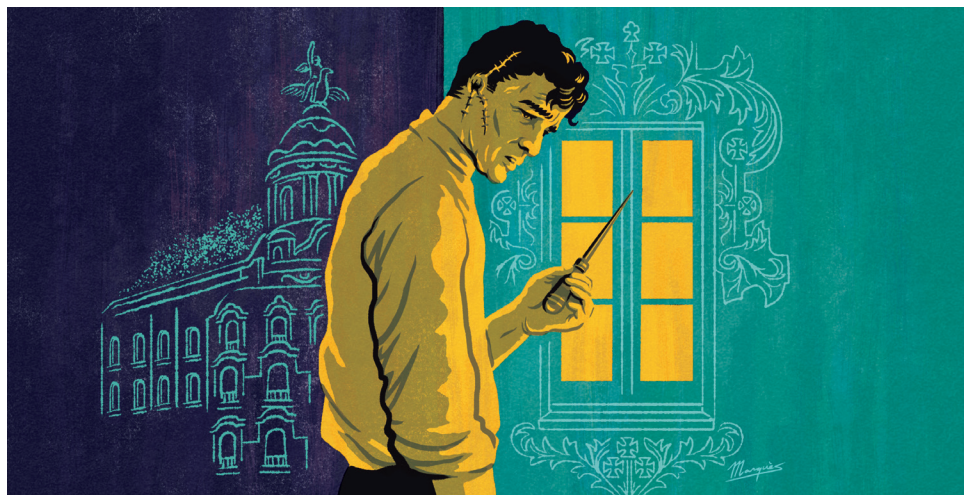
Il·lustració de coberta i postal d'Adrià Marquès

En el veredicte dels membres del jurat hi destaquen cinc punts pels quals Seré el teu mirall és la guanyadora per unanimitat del primer Premi Santa Eulàlia. En paraules seves, són: