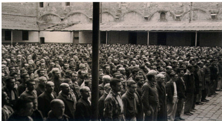
Sant Miquel dels Reis durant l'època franquista, en què era presó. Autor i any desconeguts.