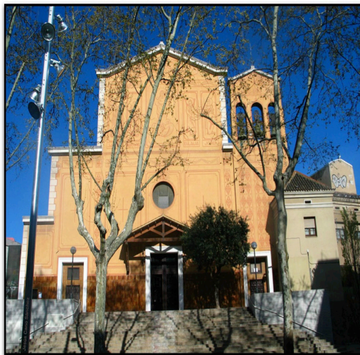
Església Santa Maria de Sants. Autor desconegut, actualitat.