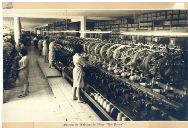
Secció de fabricació de fils a la fàbrica de seda Lombard, a Almoines. Autor i any desconeguts.