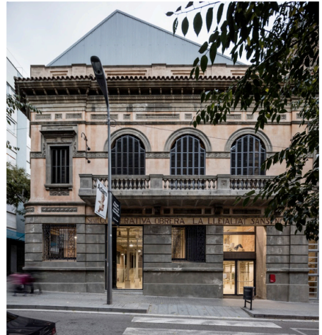
CC Lleialtat Santsenca. Foto d'Adrià Goula, actualitat.

La novel·la també traça un petit mapa de presons. En Lluís, l'home de la primera Maria, començarà passant temporades a la Model de Barcelona, a causa de les vagues i altres incidents al carrer, durant la Guerra Civil serà empresonat a la Càrcel de Lorca, a Múrcia, des d'on serà traslladat a la presó de Sant Miquel dels Reis, a València, un monestir que durant l'època franquista va ser presó i actualment és la seu de la Biblioteca Valenciana i de l'Acadèmia Valenciana de la Llengua, i finalment anirà a parar a una altra Model, la de Madrid.