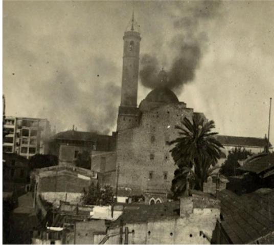
Església Santa Maria de Sants, cremant, durant la Guerra Civil, en què va ser destruïda. Autor desconegut, 1936.