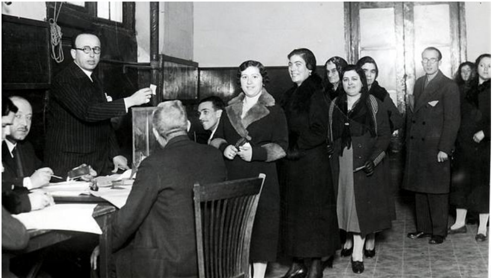
Dones fent cua per votar a Barcelona, en la primera vegada que exercien el dret a vot, el novembre del 1933.