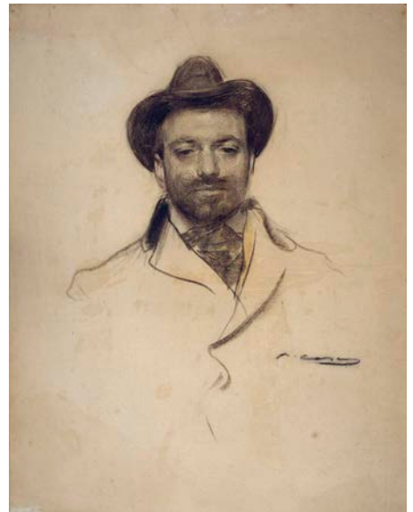
Retrat de Josep Maria Sert, per Ramon Casas (cap al 1904).

Al llarg de la seva carrera, va pintar murals en salons privats i públics arreu d'Espanya, França, Anglaterra i els