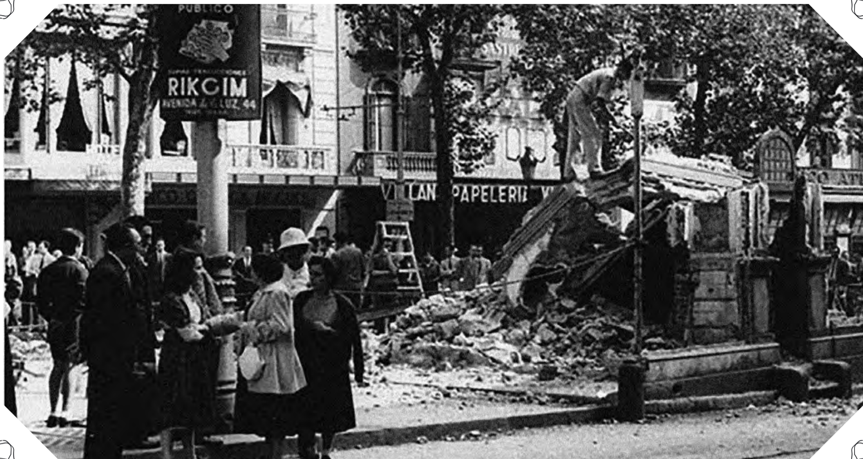
Els vianats de La Rambla es miren amb pena l'enderroc del quiosc.